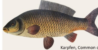
Karpfen, Common carp Cyprinus carpio