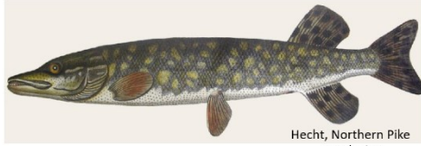
Hecht, Northern Pike Esox lucius