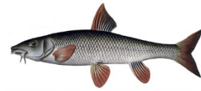
Barbe, Common barbel Barbus barbus