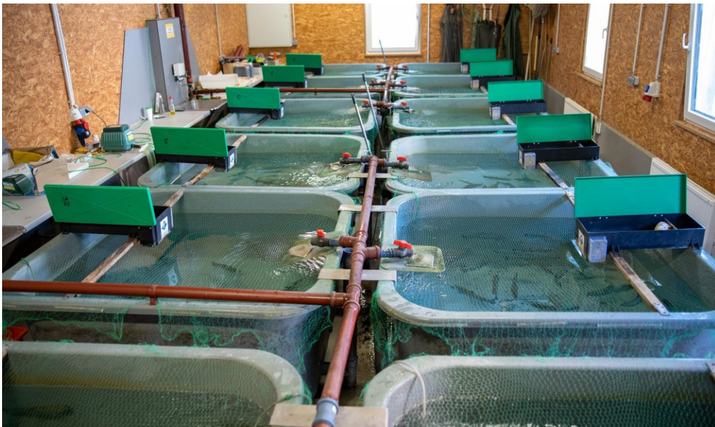
Figure 2: Fish tanks for the investigation of different food types and the effects on the growth and behavior of fish.